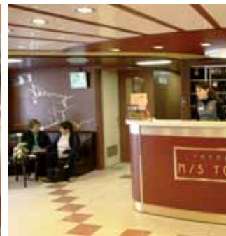
Piscina, Restaurante y animación del Ms Tolstoy uno de los mejores barcos por el Volga

navegación hacia Goritzky . Cena típica ucraniana , concierto folklórico y música en vivo. Noche a bordo.