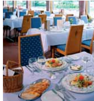
Restaurante del MS Alemania

Desayuno buffet y salida hacia Brujas , una de las más pintorescas ciudades de Europa. Un museo romántico al aire libre, hecho de iglesias,