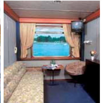
Camarote del MS Alemania

casas gremiales y canales, considerada Patrimonio de la Humanidad, y una de las mejor conservadas de la época medieval en Europa. Destacamos la Plaza Mayor , la Plaza de Burg , con el Ayuntamiento , el Palacio de Justicia y la Basílica de la Santa Sangre , etc. Almuerzo. Continuación hasta Gante , "ciudad hermana" de Brujas, donde nació Carlos I en 1500. Continuación del viaje hasta Bruselas . Cena y alojamiento. Recorrido nocturno incluido por la Grand Place , una de las más bellas del mundo.