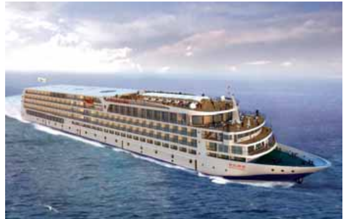
Barco MS MS Paragon Century

filaderos. Una espectacular visita entre rocas majestuosas, rodeadas de bambú y árboles milenarios. Continuaremos nuestro viaje hasta el desfiladero de Wu, conocido como el desfiladero de la Bruja; pasaremos por el desfiladero de Qutang y atravesaremos pequeños pueblos que parecen detenidos en el tiempo.