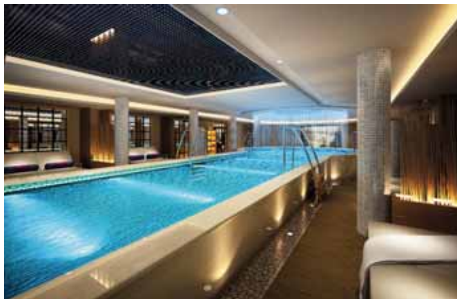
Piscina del Barco MS Paragon Century

cosechas y dar gracias al cielo por los frutos obtenidos. Desde 1998 está considerado como Patrimonio de la Humanidad por la UNESCO. Por la noche, tendrán la posibilidad de asistir opcionalmente a la ópera de Pekín con cena.